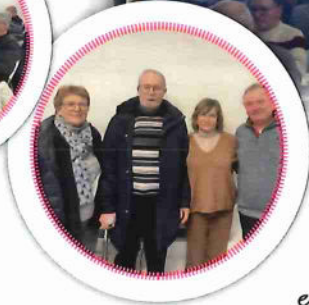
Février 2025 Ouverture sentiers : Chemin de Rache et Impasse de la Garenne