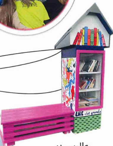
Nouvelle boîte à livres