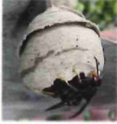
La fondatrice édifie seule un nid de fondation dit « nid primaire »

Sphère suspendue avec une petite ouverture vers le bas