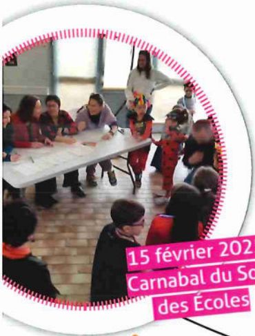
15 février 2025 Carnabal du Sou des Écoles