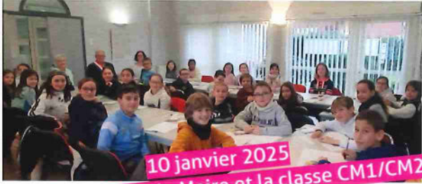
10 janvier 2025 Rencontre avec le Maire et la classe CM1/CM2